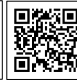
② 埼玉県中体連専門部